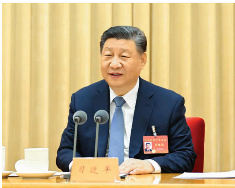
12月11日至12日，中央经济工作会议在北京举行。中共中央总书记、国家主席、中央军委主席习近平出席会议并发表重要讲话。