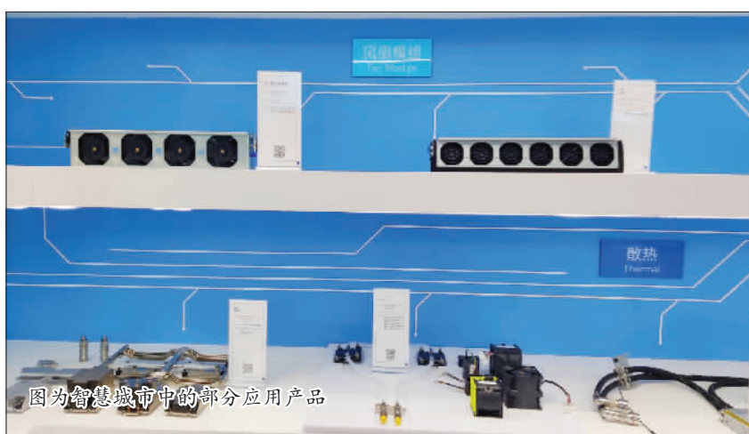
图为智慧城市中的部分应用产品