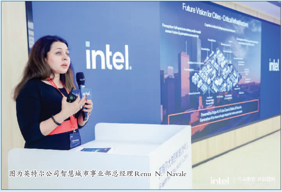
图为英特尔公司智慧城市事业部总经理Renu N. Navale

近一年来，在AI热潮的推动下，智慧城市领域发生了哪些变化，又出现了哪些新的市场机会？《中国电子报》与英特尔公司智慧城市事业部总经理Renu N. Navale展开了深度对话。