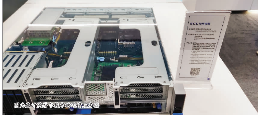
图为基础于英特尔技术的边缘服务器