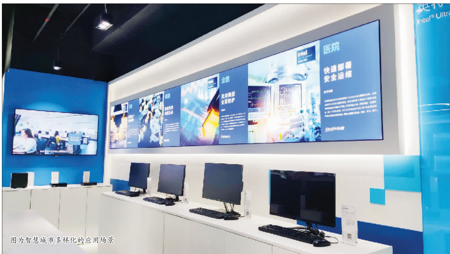
图为智慧城市多样化的应用场景

Renu N. Navale： 算力是个共性问题，在智慧社区、智慧城市当中，对于算力的需求也是与时俱进的。我们要做的各种信息化应用都离不开算力，算力需求是基础性的存在。例如，若要优化城市交通管理，就需要无穷无尽的算力支撑。如何提供算力，并将其应用到场景的各个细节中，是我们长期思考的问题。