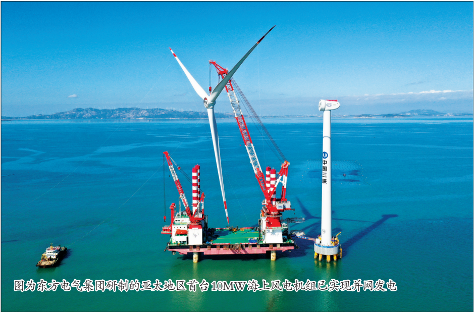
图0为东方电气集团研制的亚太地区首台10MW海上风电机组已实现并网发电

(五)强化运行日常监测调度,确保全年工业平稳运行。一是强化规上企业培育。建立“小升规”企业培育库“一对一”服务,力争全年新升规企业600家。建立有效机制,每个重点行业着力培育2~3家优势企业建设行业领军企业。二是强化能源要素保障。建立“一对一”协调机制,强化重点煤源、气源和电力供应保障。会同交通物流等部门,帮助企业打通物流渠道。抓好龙头企业供应链融资、商业价值信用贷款等,缓解企业融资难题,多措并举进一步降低企业生产经营成本。三是强化运行调度。进一步完善调度机制,强化运行监测,及时解决障碍问题,以更高效的方法推动工业经济加快发展。