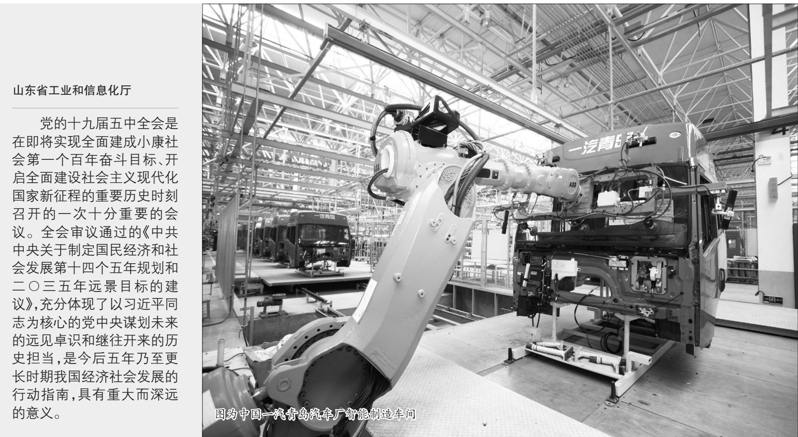
山东省工业和信息化厅

党的十九届五中全会是在即将实现全面建成小康社会第一个百年奋斗目标、开启全面建设社会主义现代化国家新征程的重要历史时刻召开的一次十分重要的会议。全会审议通过的《中共中央关于制定国民经济和社会发展的第十四个五年规划和二〇三五年远景目标的建议》,充分体现了以习近平同志为核心的党中央谋划未来的远见卓识和继往开来的历史担当,是今后五年乃至更长时期我国经济社会发展的行动指南,具有重大而深远的意义。