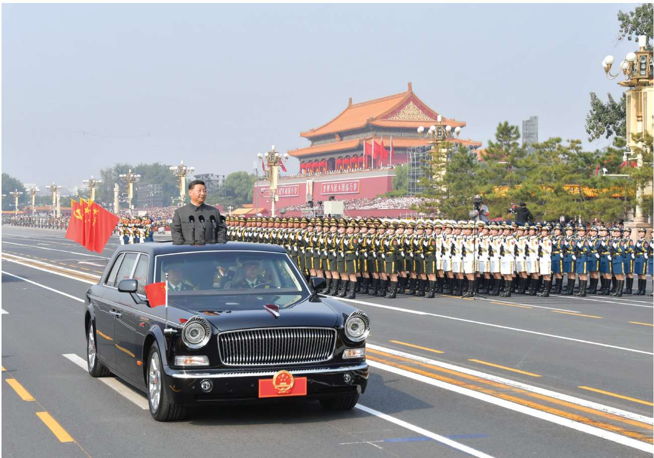
10月1日，庆祝中华人民共和国成立70周年大会在北京天安门广场隆重举行。这是中共中央总书记、国家主席、中央军委主席习近平检阅受阅部队。

新华社北京10月1日电 壮阔七十载，奋进新时代。10月1日上午，庆祝中华人民共和国成立70周年大会在北京天安门广场隆重举行，20余万军民以盛大的阅兵仪式和群众游行欢庆共和国70华诞。中共中央总书记、国家主席、中央军委主席习近平发表重要讲话并检阅受阅部队。 中共中央政治局常委、国务院总理李克强主持庆祝大会。中共中央政治局常委、全国人大常委会委员长栗战书，中共中央政治局常委、全国政协主席汪洋，中共中央政治局常委、中央书记处书记王沪宁，中共中央政治局常委、中央纪律检查委员会书记赵乐际，中共中央政治局常委、国务院副总理韩正，国家副主席王岐山出席。 国庆节之际，神州大地山河壮丽，万众欢腾，首都北京花团锦簇，旌旗飘扬。 蓝天丽日下，天安门城楼庄严雄伟。城楼红墙正中悬挂着毛泽东同志的巨幅彩色画像。城楼檐下8盏大红灯笼引人注目，东西平台上8面红旗迎风招展，烘托出喜庆的节日气氛。 天安门广场上，大型“红飘带”主题景观庄重、灵动，寓意红色基因连接历史、现实、未来。人民英雄纪念碑前，竖立着伟大的革命先行者孙中山先生的画像，巨大的“国庆”“1949”“2019”立体字样分外醒目。 上午9时57分，在欢快的乐曲声中，习近平等党和国家领导人来到天安门城楼主席台，向广场观礼台上的各界代表挥手致意。全场爆发出雷鸣般的掌声。 天安门广场上的大型电子屏幕中出现了钟摆的画面。1949、1959、1969……2019，随着钟摆，年份数字依次显现。报时钟声响起，10时整，庆祝大会开始。 全体起立，70响礼炮响彻云霄，国旗护卫队官兵护卫着五星红旗，迈着铿锵有力的步伐，从人民英雄纪念碑行进至广场北侧的升旗区。中国人民解放军联合军乐团奏响雄壮的《义勇军进行曲》，全场齐声高唱中华人民共和国国歌，鲜艳夺目的五星红旗冉冉升起，在天安门广场上空迎风飘扬。 随后，习近平发表重要讲话。他首先代表党中央、全国人大、国务院、全国政协和中央军委，向一切为民族独立和人民解放、国家富强和人民幸福建立了不朽功勋的革命先辈和烈士们，表示深切的怀念，向全国各族人民和海内外爱国同胞，致以热烈的祝贺，向关心和支持中国发展的各国朋友，表示衷心的感谢。