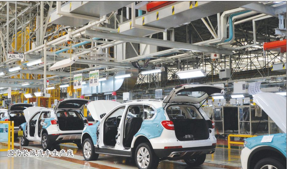
图为长城汽车生产线

(一)科学规划促转型,高质量发展政策体系基本形成。 注重转型升级顶层设计,以省委省政府、省两办和省制造强省办等名义陆续出台了《关于加快推进工业转型升级建设现代化工业体系的指导意见》《河北省“万企转型”实施方案》,以及特色产品、信息消费、工业设计、服装、钢铁、化工、建材、食品等30多个政策文件,形成转型升级“四梁八柱”,为工业转型升级和新旧动能转换指明了方向。制定印发了《河北省支持“万企转型”若干政策措施》,提出16项政策,同时,起草系列政策文件和三年行动计划落实方案,狠抓落实落地。起草了河北省第一部规范企业技术创新的地方性法规——《河北省促进企业技术创新条例》,并于9月1日起施行。 (二)千方百计稳增长,工业运行保持向好态势。 制定和实施了《工业经济重点目标任务包联督导实施方案》《工业稳增长“百日攻坚”行动实施方案》,层层传导压力、落实市县责任,盯紧看牢大企业。实施“旬调度、月通报、季总结”,对重点行业、重点地区、重点企业、重点产品加大监测分析研判力度,督导各市增比进位。督导落实重点企业联系服务“五个一”工作机制,省政企服务直通信息化平台受理问题办结率99%。组织开展涉企收费专项检查 and 产融合银企对接活动。预期全年规上工业增加值同比增长5%左右。 (三)坚定不移去产能,绿色发展取得新成效。 一是化解水泥玻璃焦炭产能。通过签订目标责任书、召开调度会、实地督导等方式积极推进,压减水泥产能313.1万吨、平板玻璃产能810万重量箱、焦炭517万吨,超额完